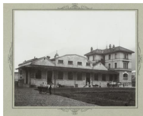
Stabilimento Branca a Chiasso